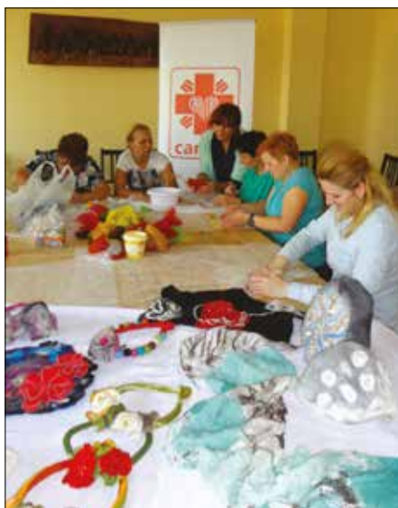
Beneficjenci projektu podczas filcowania

Dzięki środkom pozyskanym z Norweskiego Mechanizmu Finansowego 2009 – 2014 Caritas Diecezji Ełckiej realizuje od czerwca 2014 roku projekt „Walczę o siebie” w ramach Funduszu Małych Grantów dla Programu PL14 „Przeciwdziałanie przemocy w rodzinie i przemocy ze względu na płeć”. W programie biorą udział osoby, które doświadczyły lub doświadczają przemocy