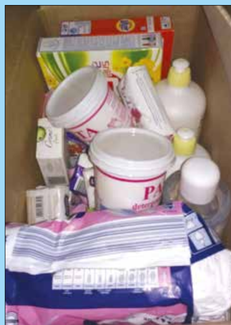
Na Ukrainę zawieziono m.in. środki czystości