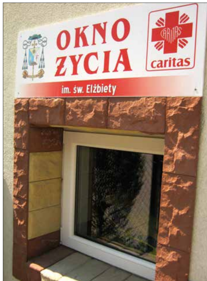
Okno życia w Giżycku

Postulat zamknięcia w Europie okien życia nagłośniły media. Podchwyciły go również niektóre środowiska w Polsce. Europosłanka Joanna Senyszyn napisała na swoim blogu: „Tłumaczenie, że okna życia ratują niemowlęta przed śmiercią jest kłamliwe. Nie ma żadnych dowodów na to, że matki zabiłyby swoje dzieci, gdyby nie pozostawiłyby ich w oknach życia. Wszak dzieci są w Polsce mordowane, mimo istnienia tych okien. A może właśnie dlatego, że okna są. Okna uczą bowiem, że dziecko nie jest żadną wartością, że można je urodzić, a kiedy się znudzi lub zacznie