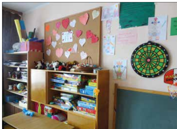
Świetlica w Olecku