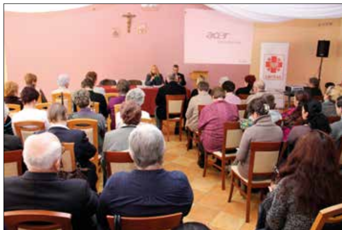
Szkolenie parafialnych zespołów Caritas

Były dwie prezentacje multimedialne: jedna – podsumowująca realizację programu PEAD 2012, druga – przygotowująca do wejścia w realizację kolejnego programu PEAD 2013. Caritas Diecezji Ełckiej już po raz dziesiąty będzie uczestniczyła w powyższym programie. W dalszej części spotkania odbyła się konferencja na temat Roku Wiary,