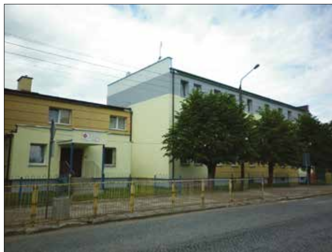
Dom św. Faustyny w Gołdapi

Wychowywanie to odpowiedzialność, a jednocześnie zajęcie dające ogromną satysfakcję. Każdy sukces dziecka to impuls do dalszego działania, ale to również sukces wychowawcy. Uczymy wychowanków, że wiara czyni cuda. Poprzez cotygodniowe uczestnictwo we mszy św. wpajamy im pewność, że nawet, gdy wydaje im się, że wszyscy ich opuścili, to jest Ktoś, Kto zawsze o nich pamięta i nigdy ich nie zawiedzie. Przybliżyliśmy postać św. Faustyny jako wzór do naśladowania. Staramy się, by swoim przykładem pokazać im, że nie ma rzeczy niemożliwych, wszystko zależy od naszej determinacji w dążeniu do wyznaczonego celu. Uczymy je, by pamiętały, że po każdej nocy przychodzi dzień, a wszystko to, co oferujemy im w Domu Świętej Faustyny w Gołdapi, jest jak wschodzące słońce, które z uśmiechem wita każdy nowy dzień.