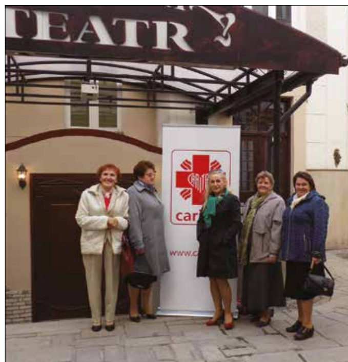
Elczanki przed Teatrem Kamienica