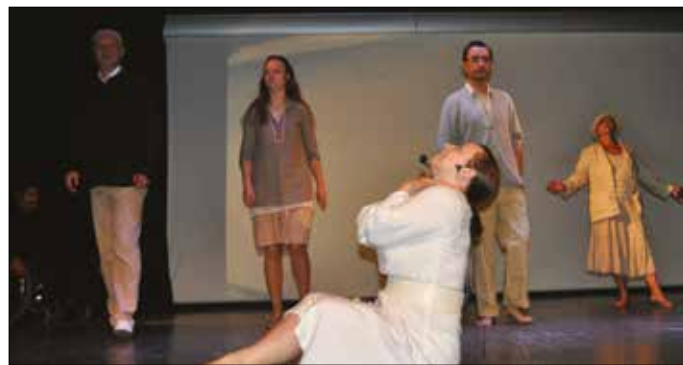
Występ osób niepełnosprawnych